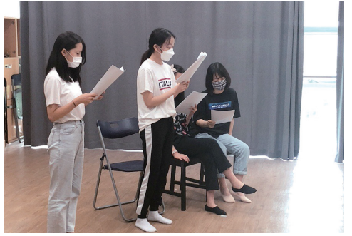
영재학급 연극영화과 수업 모습