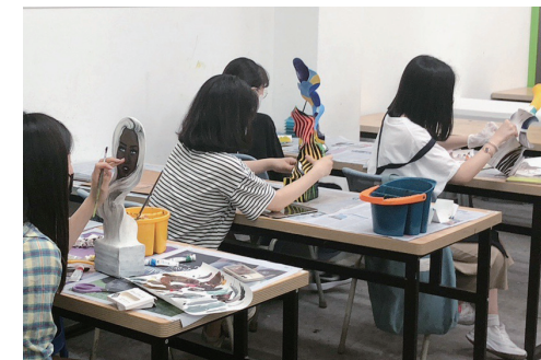
영재학급 미술과 수업 모습