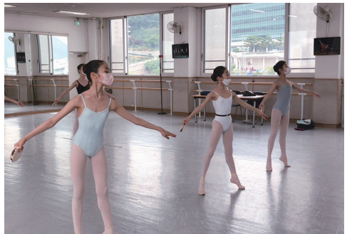
영재학급 무용과 수업 모습