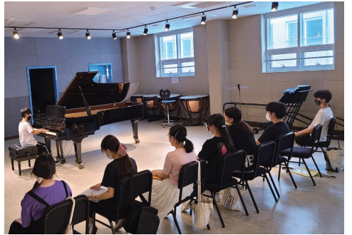
영재학급 음악과 수업 모습