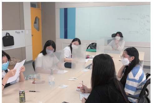
영재학급 문예창작과 수업 모습